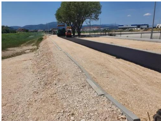
FOTO Započeli asfalterski radovi na projektu »Izgradnja pristupne ...

09.06.'26 Opuzen: [FOTO] • [Započeli asfalterski radovi na